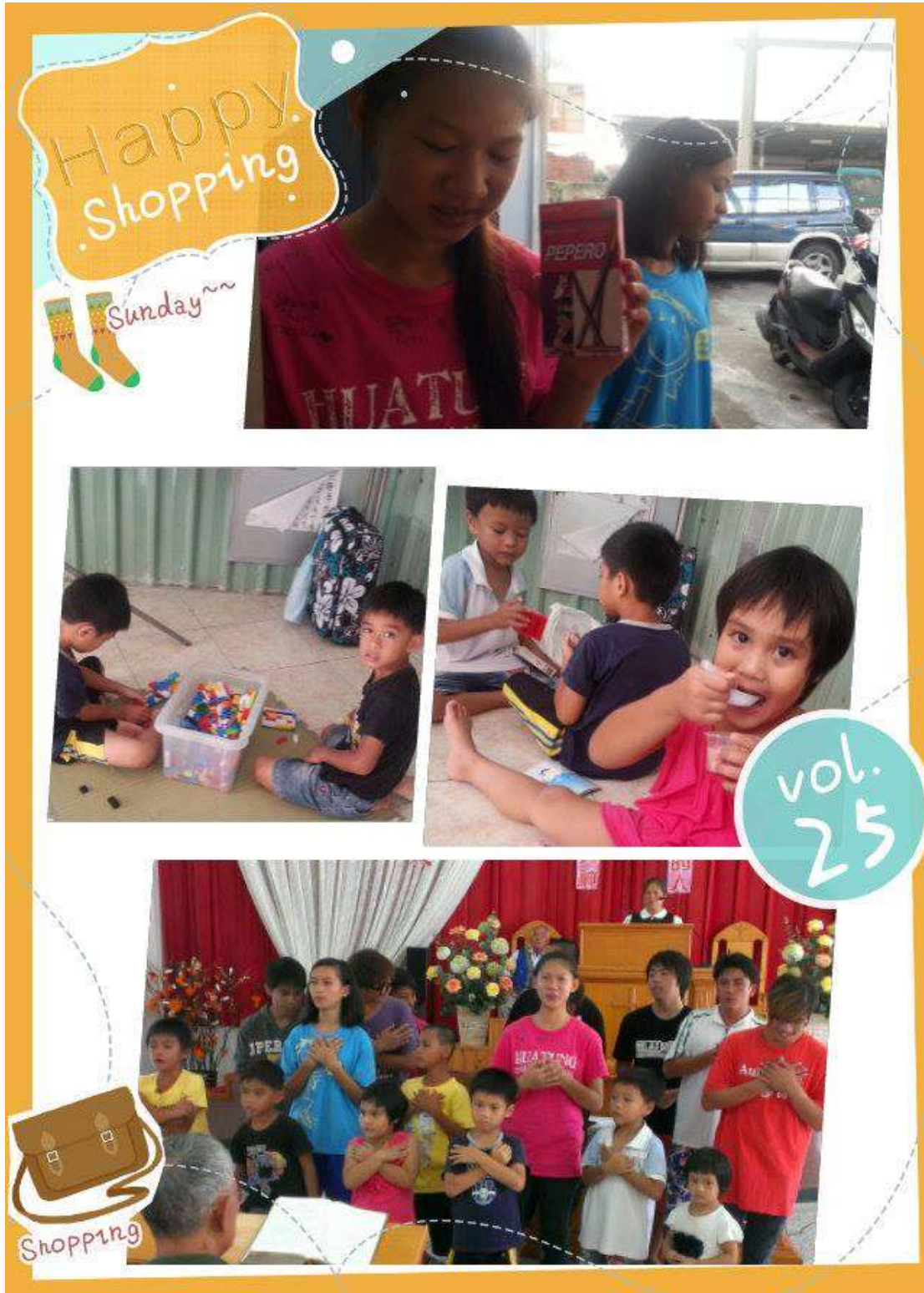
3. 兒童主日學聚會課程時間及唱詩實況