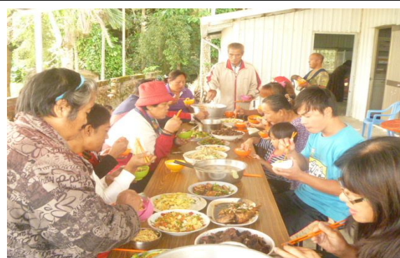
【圖 7】婦女會的手藝（色、香、味）-有餐飲證照