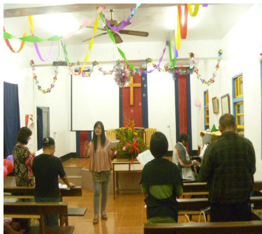
【圖 2】：週六中年團契聚會及練詩歌