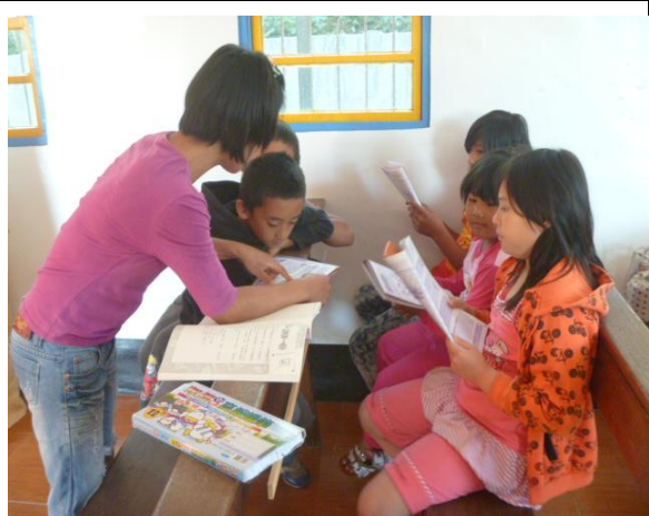
【圖 5】：慧卿老師分班教導中級班