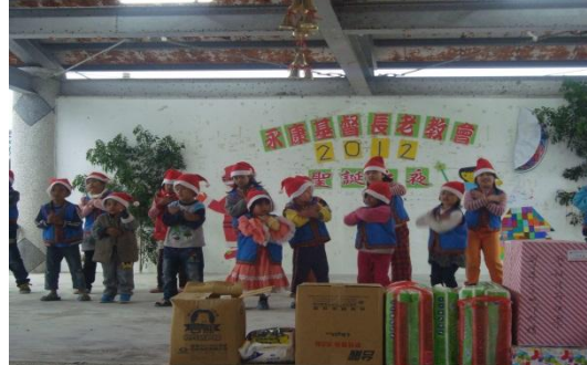
【圖 12】:12/23 聖誕節主日學表演