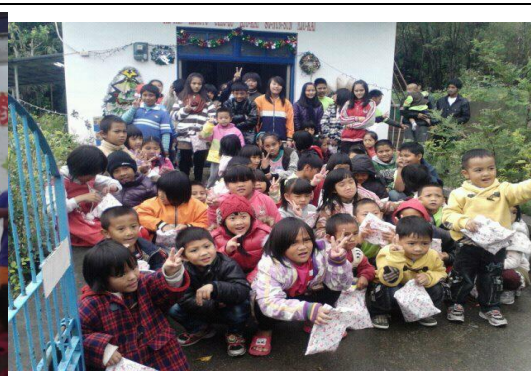
【圖 14】:12/30 聯合主日學聖誕禮拜