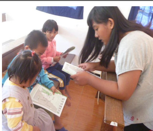
【圖 4】：分班有小老師分工教導幼兒級班