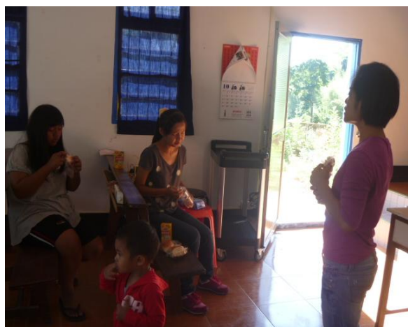
【圖 1】：青少年團契組成前的討論