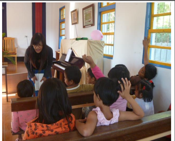
【圖 3】：主日學禮拜實習生主禮聖經故事，小朋友認真聽，也會主動發問問題。