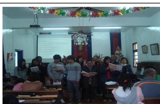
【圖 10】:12/22 聖誕感恩禮拜青少年團契獻詩