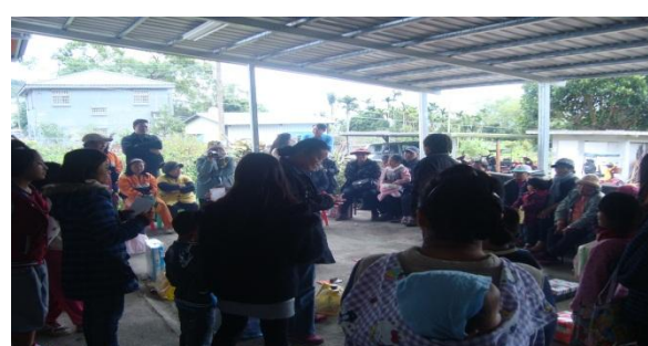
【圖 11】:12/23 聖誕節聚會後摸彩的心情~