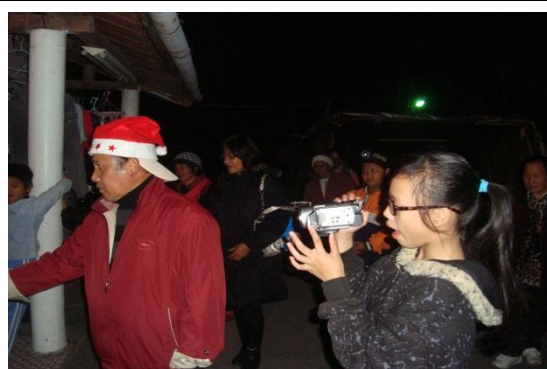
【圖 8】12.22 晚上報佳音，信徒家！