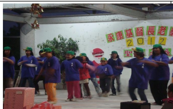
【圖 13】:12/23 永康教會青少年.組員表演