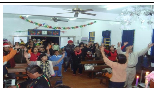
【圖 9】:12/22 報佳音後到教會聖誕崇拜，每戶到教會