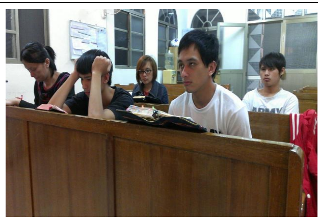
青少年團契讀經實況