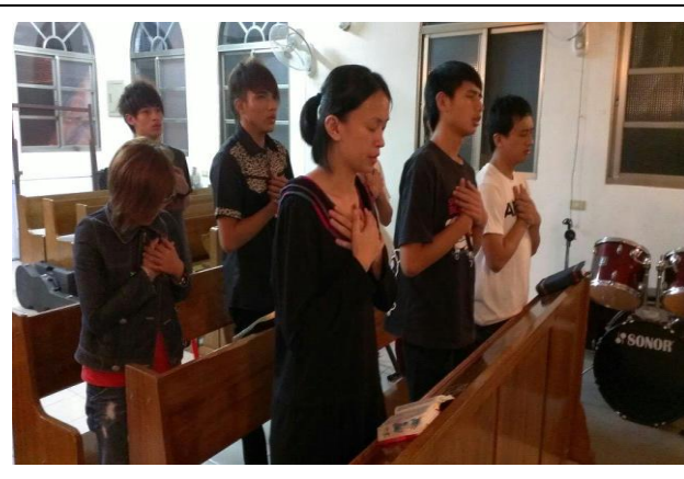
青少年禱告團契實況