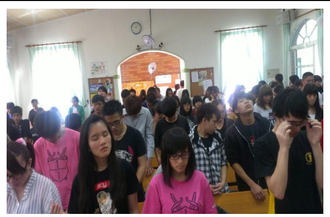
太魯閣中會青少年禁食禱告會(威朗教會)