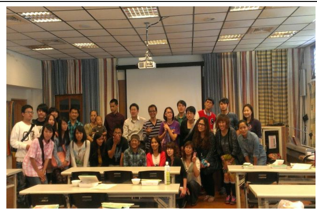
TKC 輔導培訓營 說明會