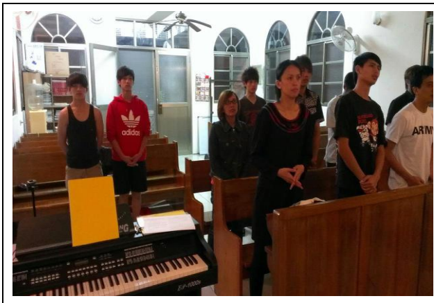
青少年團契敬拜實況