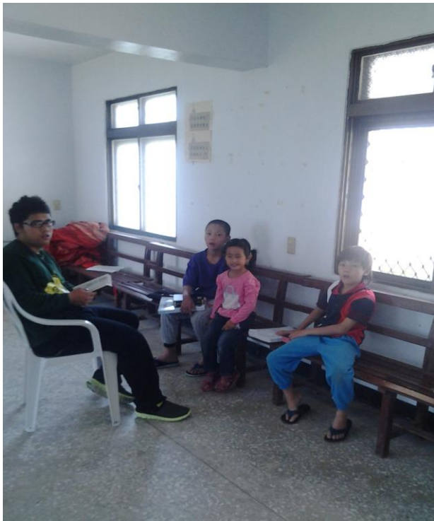
兒童主日學真理教導 1