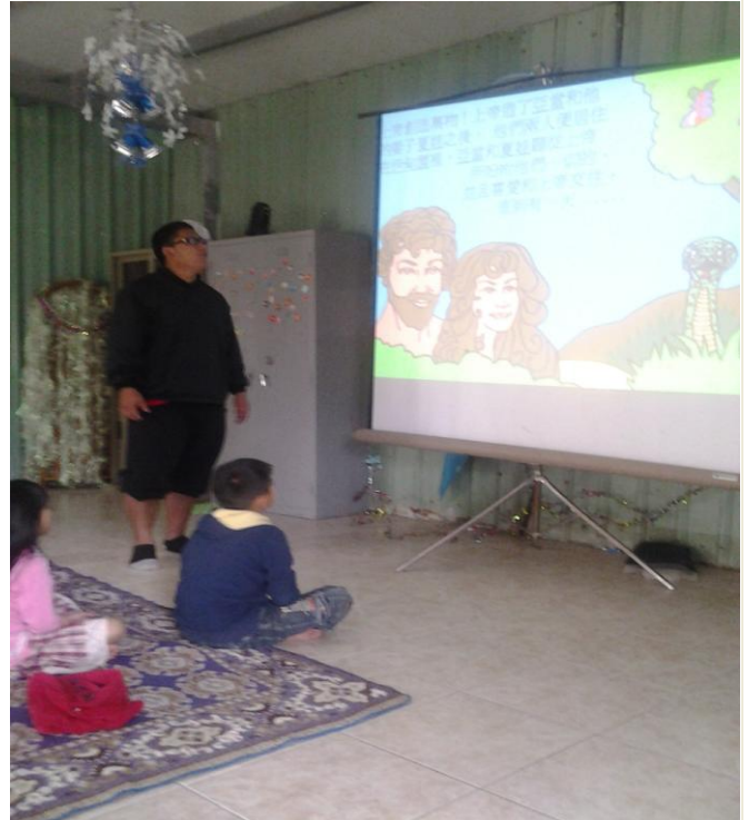
兒童主日學真理教導 2