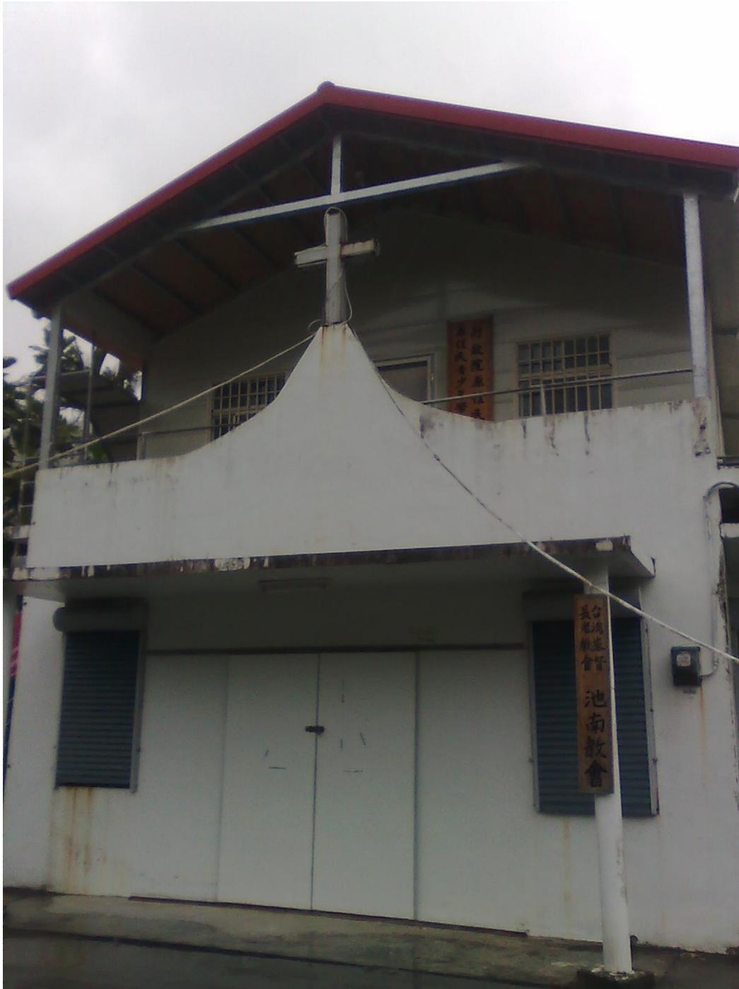
阿美中會池南教會