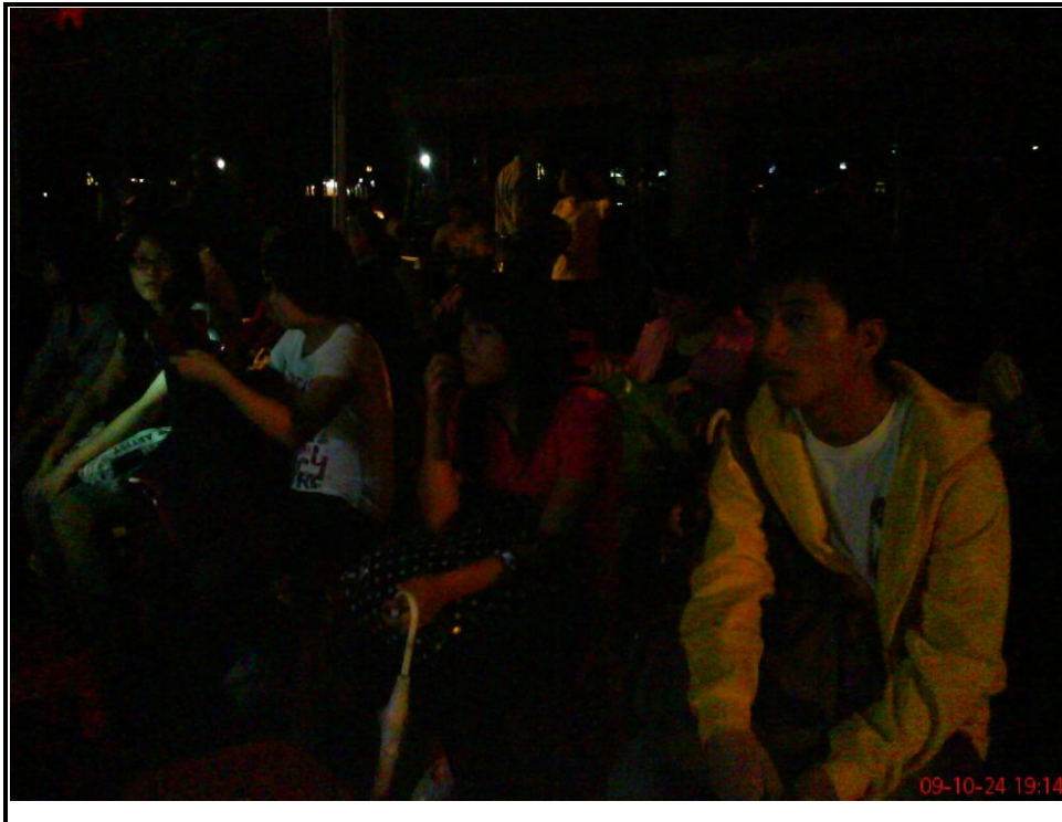
時間：98/10/24。 地點：中和四號公園。 內容：學青們都很認真在聽詩歌，以及講員的生命見證分享。