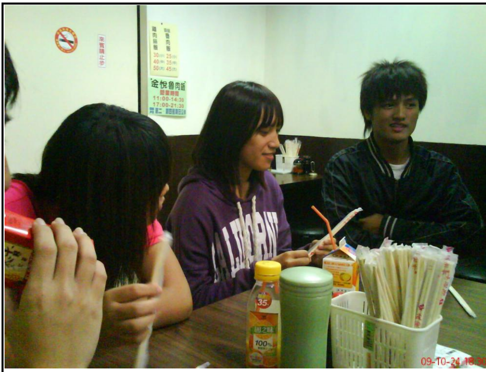
時間：98/10/24。 地點：中和小吃店。 內容：會後學青們在一起分享參與「我的老大是耶穌」佈道會的感動與心得，彼此激勵與成長。