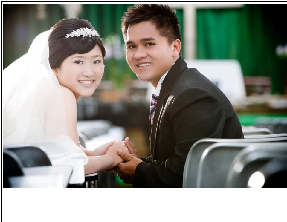
我 結 婚 的 照 片