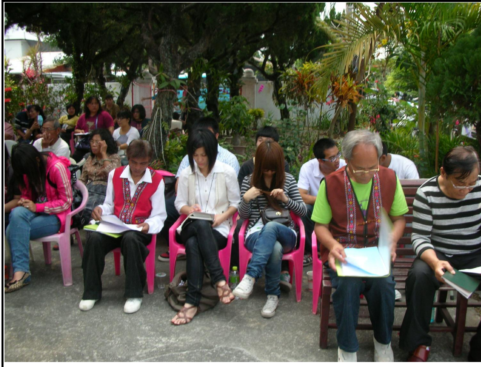
主 日 聯 合 禮 拜