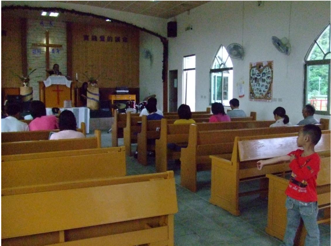
2. 青少年團契聚會課程時間及練詩讚美實況