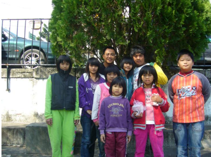
我與我的主日學小朋友，教會未來的支柱