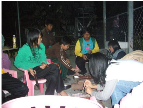
三個月一次的烤肉會